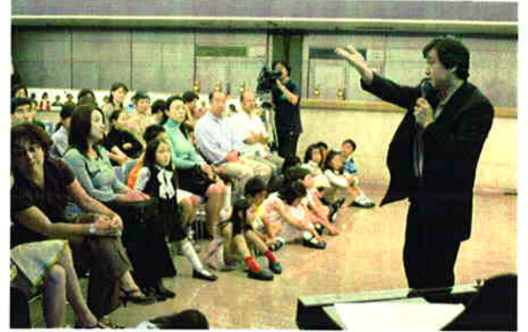
大野さんも一緒に見学してくれました！