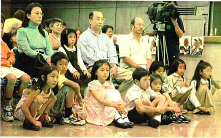
みんな真剣そのもの！