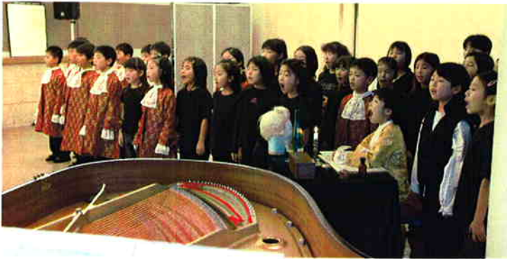
イタリア語で元気一杯に歌ってくれました。